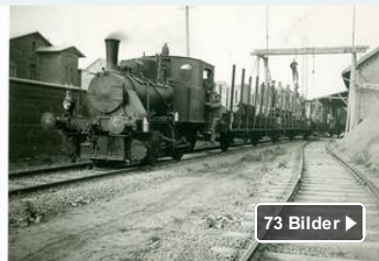
Bilder zu Misburg